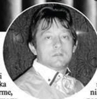
Piše: Zoran Petrović Šumadinac

U sljedećem nastavku govorit ću o magiji i nezgodama, povredama i traumama; magiji smrti, magiji na novorođenčad te Sukubj i Inkubj, demonima koji seksualno napadaju žrtve suprotnog spola