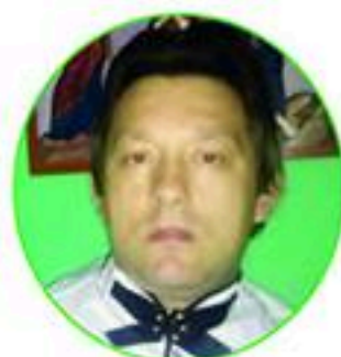
Piše ezoterista Zoran Petrović Šumadinac

Ljudsko tijelo je povezano sa planetarnim vladavinama, i predstavljeno je kroz svih 12 znakova. Osobine koje čovjeka čine ličnošću, koje stvaraju način mišljenja, nastaju pod utjecajem aspekata planeta. Isti aspekti su zaduženi za bolesti, povrede, i samim tim i formiranje spoljašnjeg izgleda.